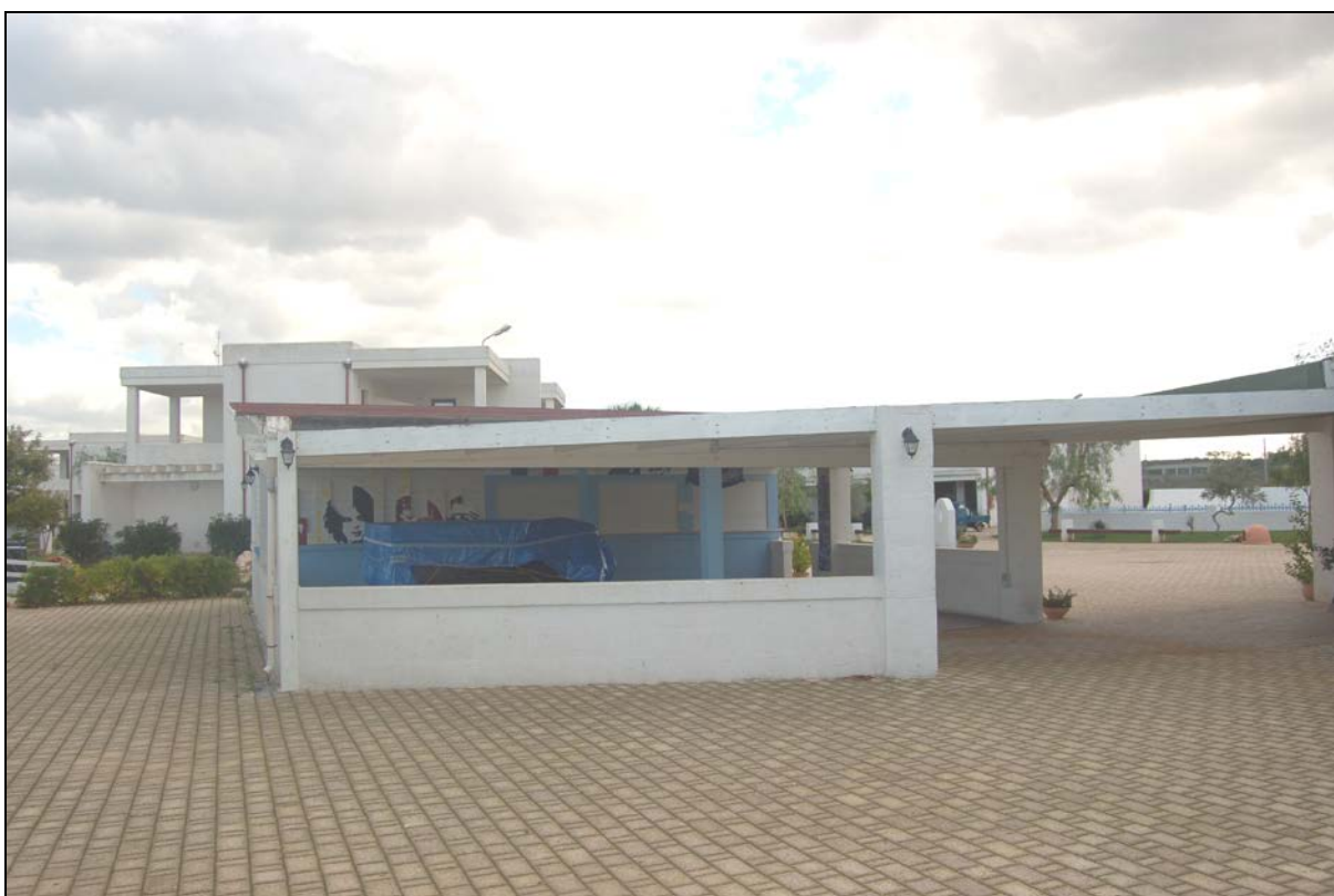
Particolare Chiosco bar, pergolato da mantenere a carattere fisso - permanente