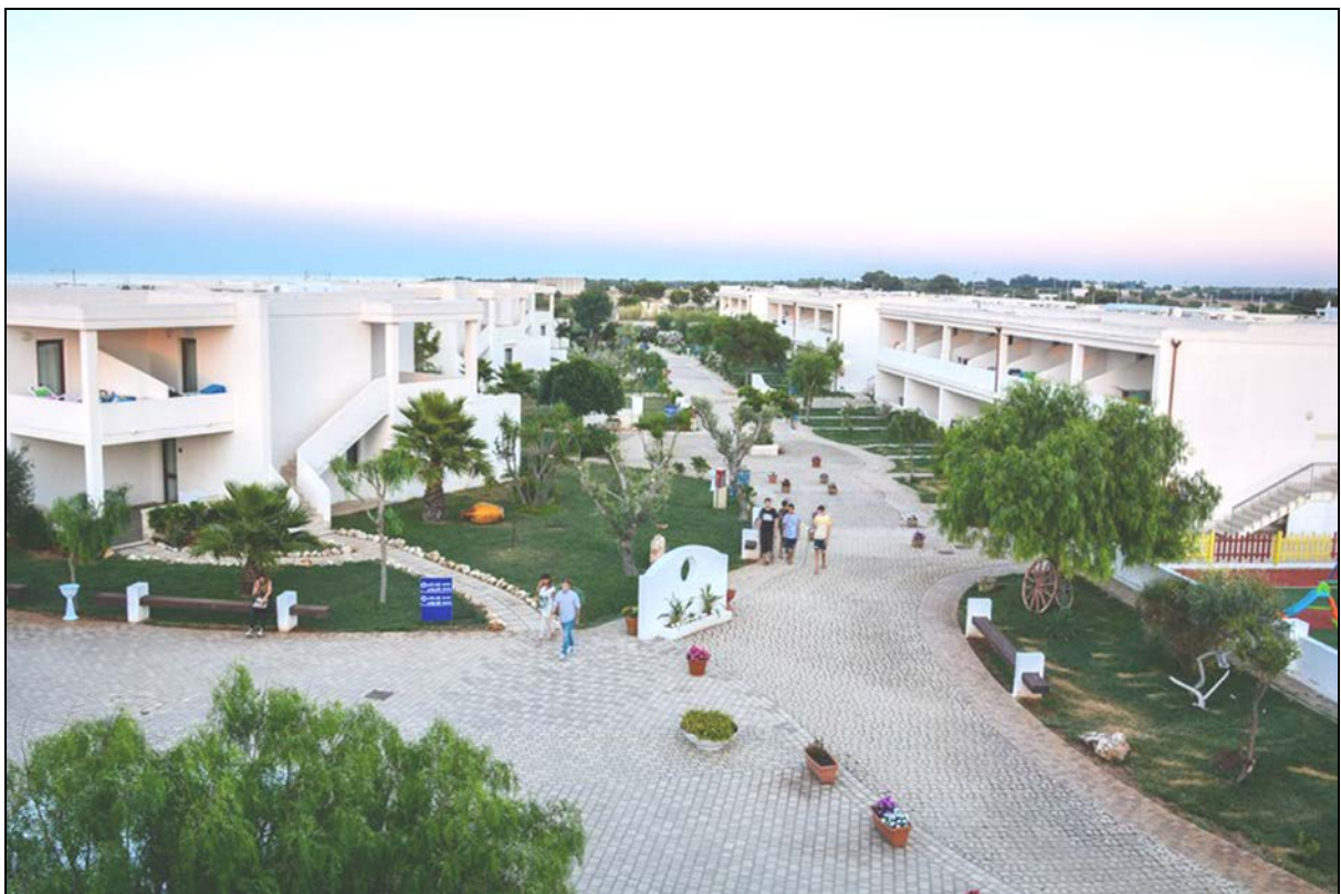
Vista dall'alto ingresso struttura ricettiva