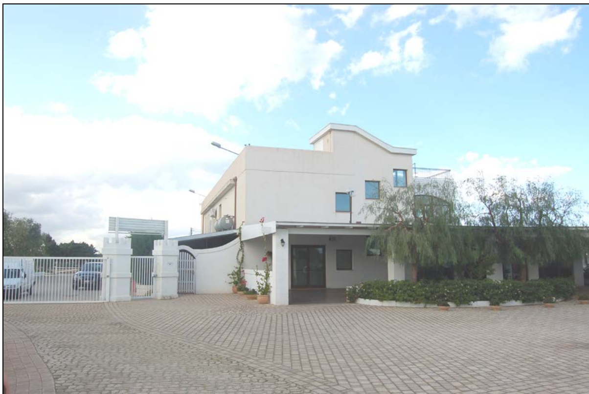
Particolare ristorante e pergolato da mantenere a carattere fisso - permanente