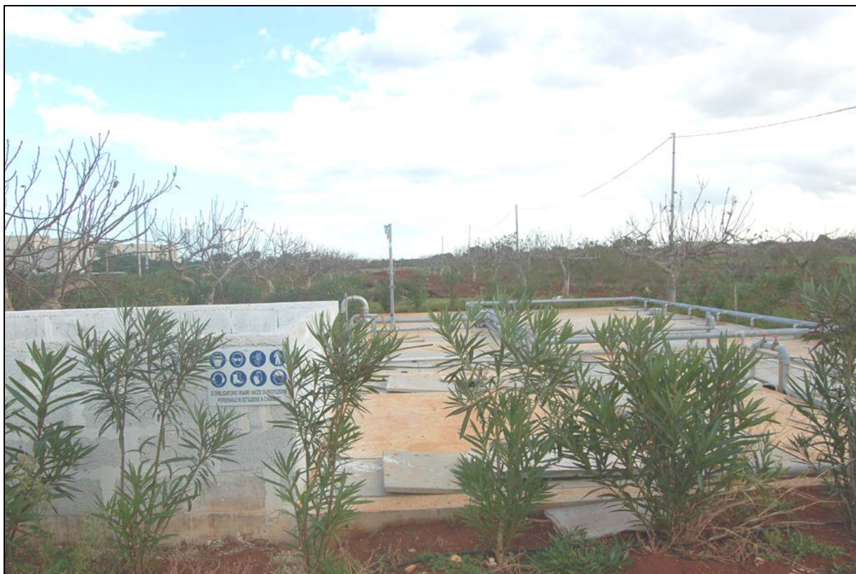
Particolare impianto di depurazione acque reflue esistente