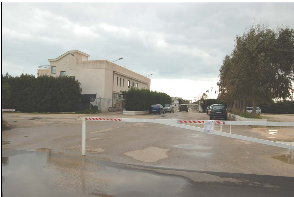
Ingresso struttura ricettiva percorrendo strada comunale Bufalaria