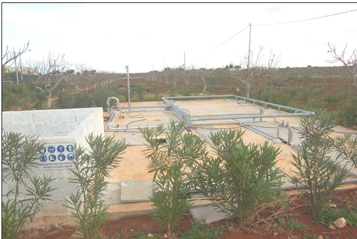
Particolare impianto di depurazione acque reflue esistente