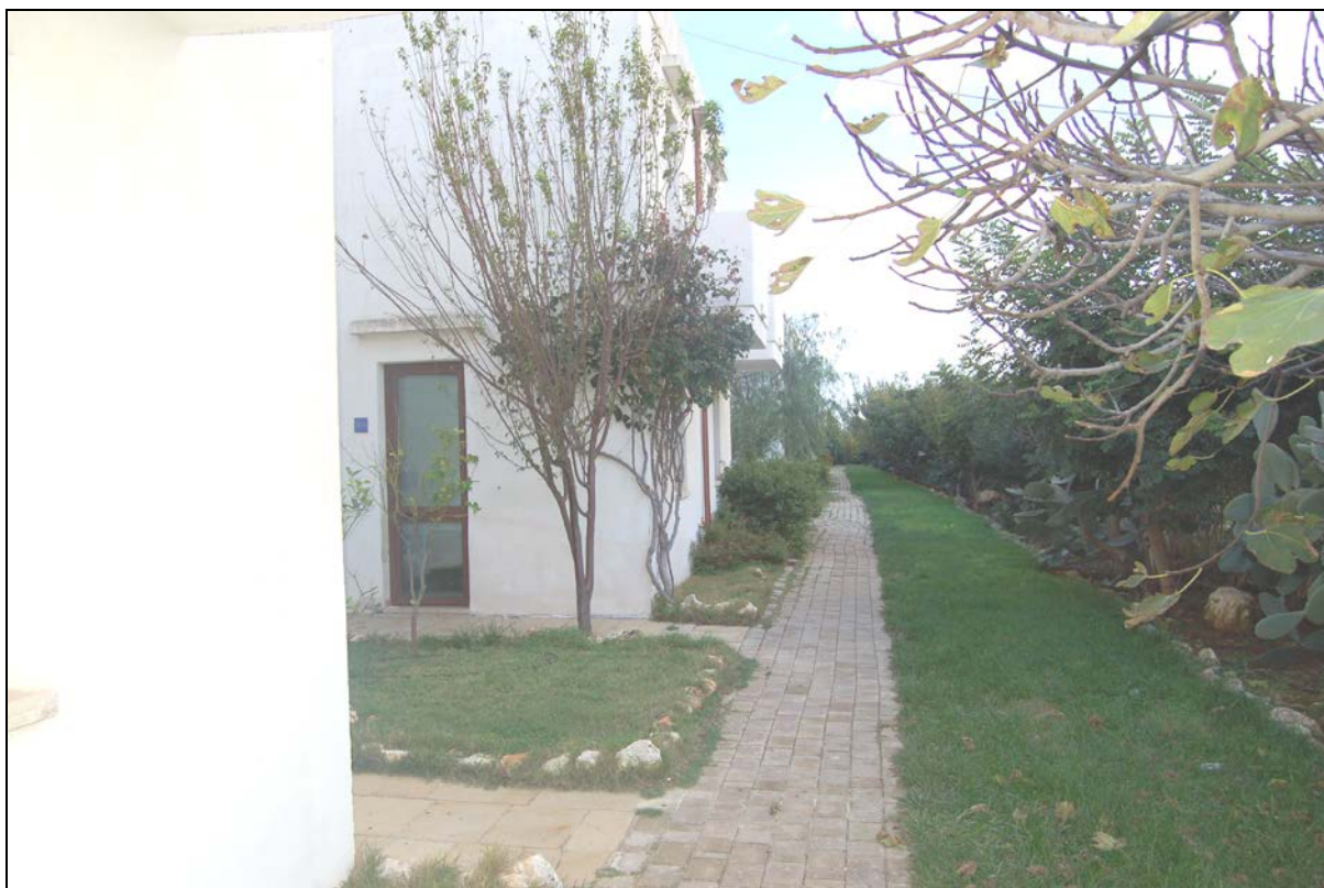
Particolare blocco camere "A" esistente