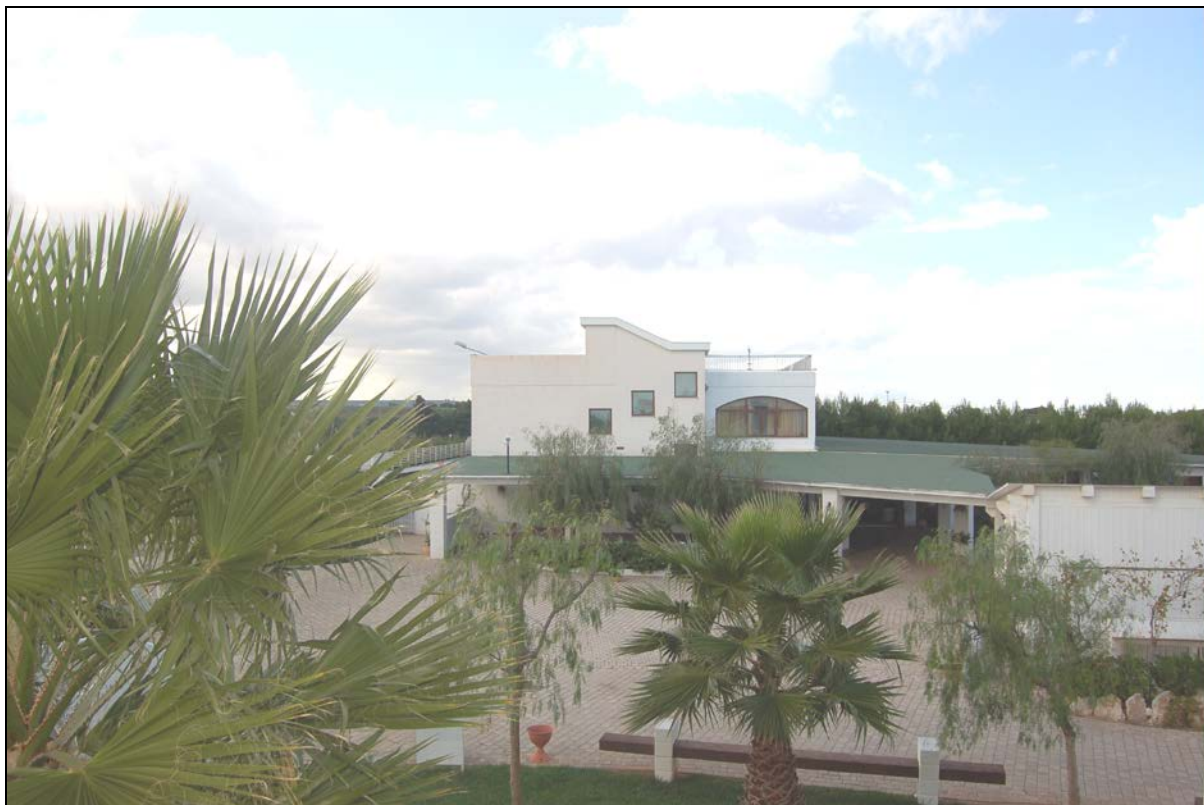
Particolare ristorante e pergolato da mantenere a carattere fisso - permanente