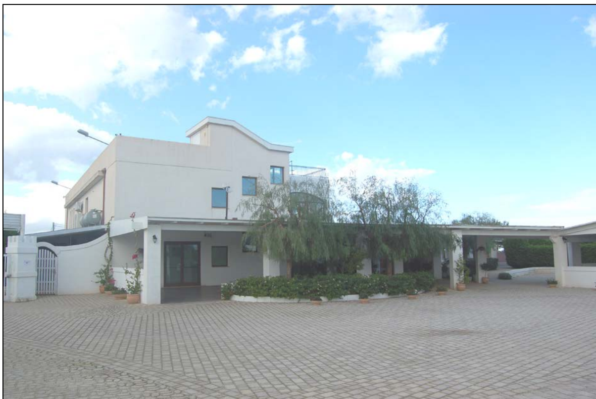
Particolare ristorante e pergolato da mantenere a carattere fisso - permanente