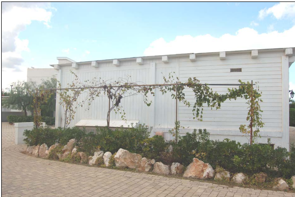
Particolare Chiosco bar, pergolato da mantenere a carattere fisso - permanente