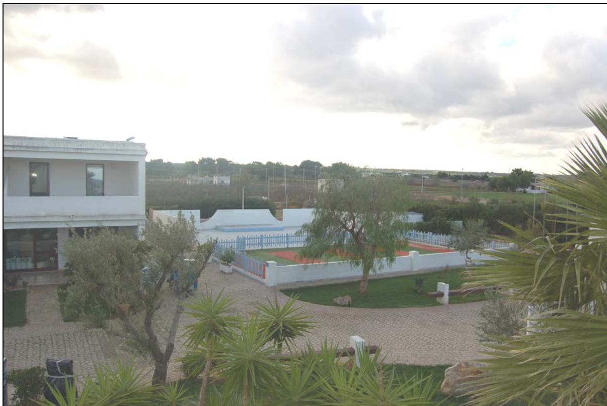
Particolare area su cui sorgerà a Centro Benessere SPA