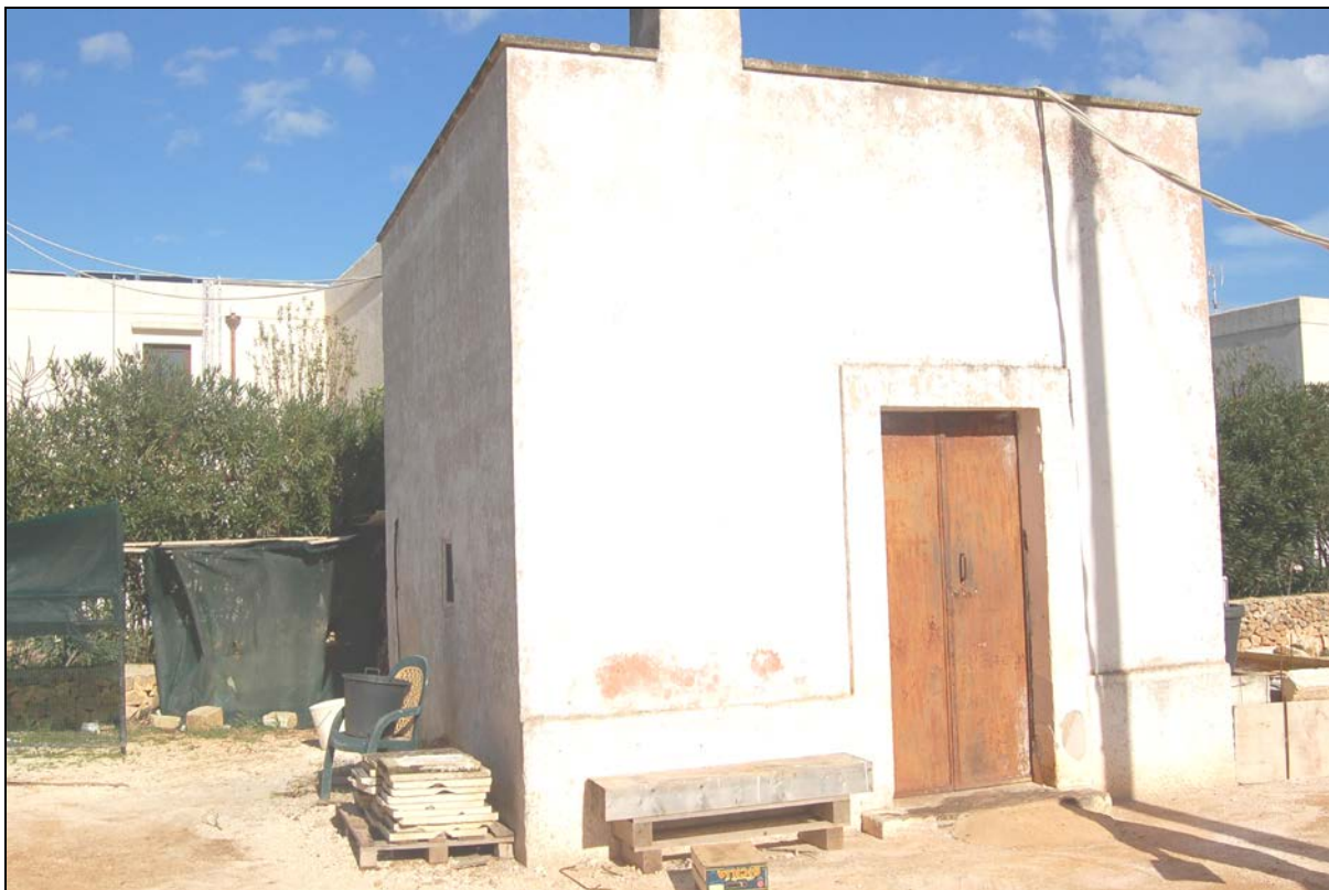
Particolare fabbricato rurale da demolire