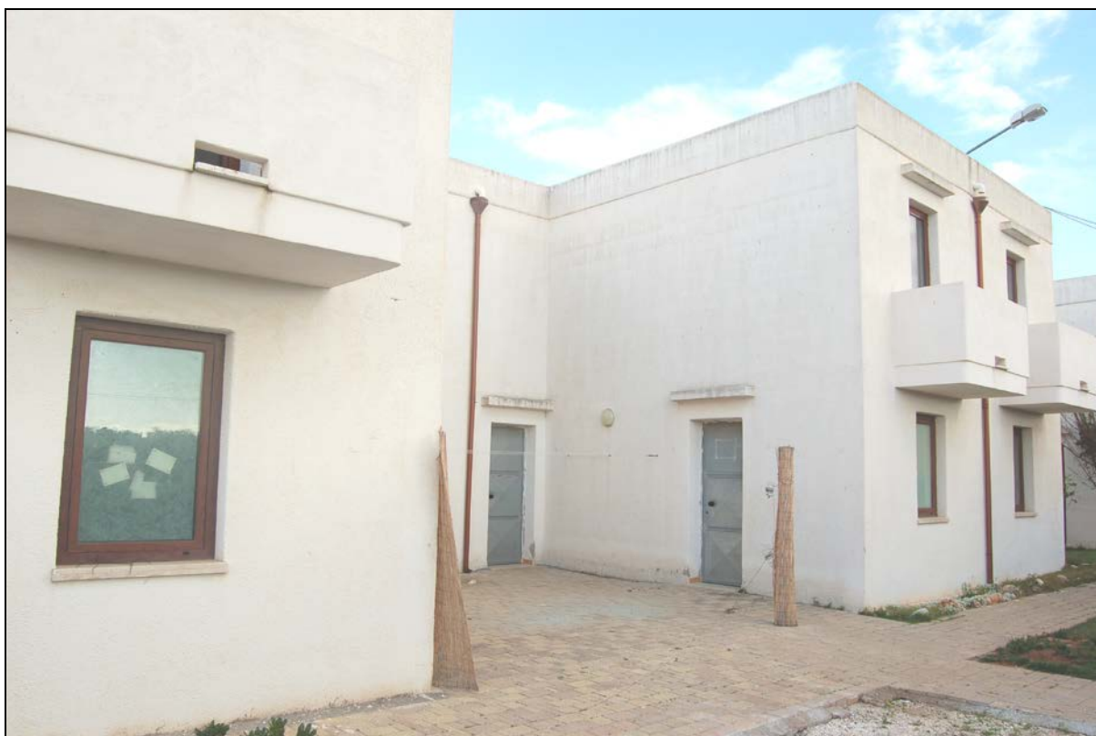
Particolare blocco camere "A" esistente