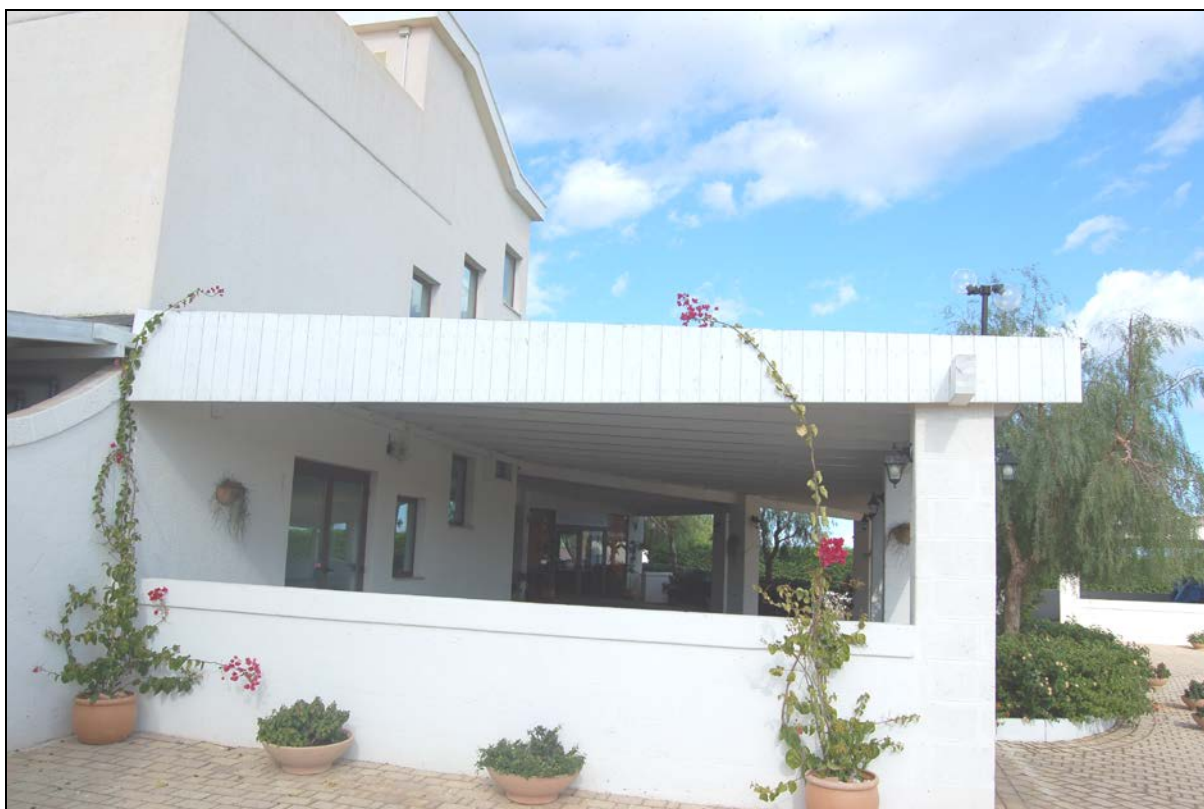
Particolare ristorante e pergolato da mantenere a carattere fisso - permanente