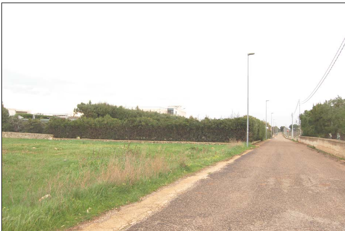
Struttura ricettiva percorrendo strada comunale Bufalaria