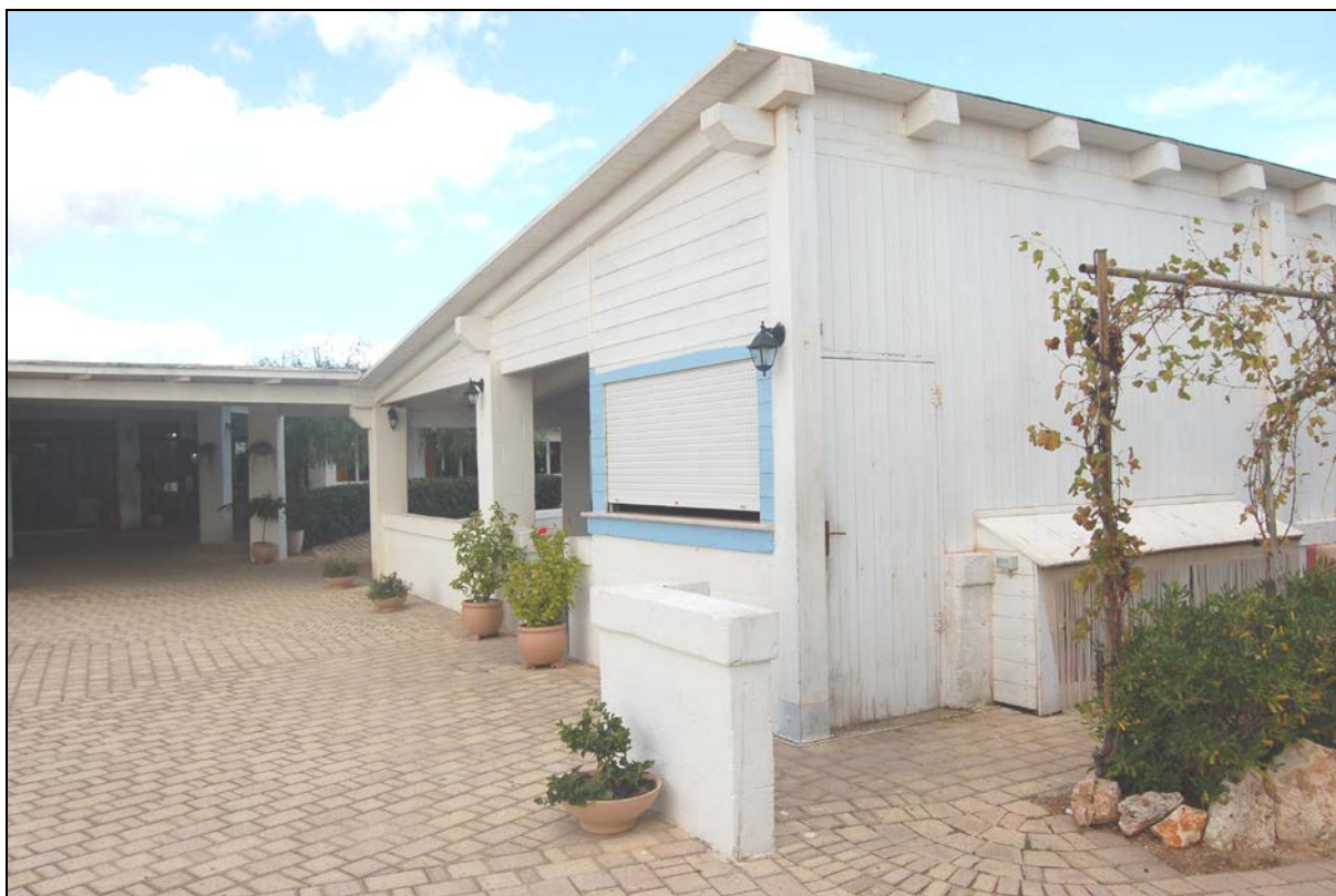
Particolare Chiosco bar, pergolato da mantenere a carattere fisso - permanente