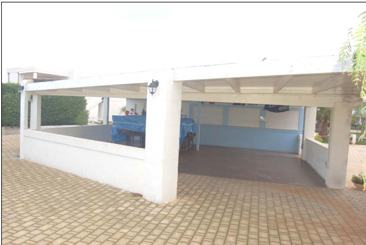
Particolare Chiosco bar, pergolato da mantenere a carattere fisso - permanente