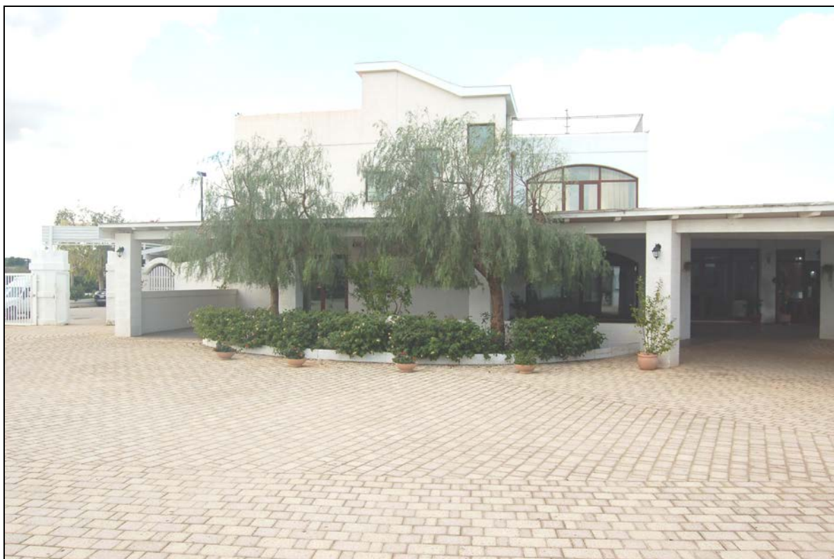
Particolare ristorante e pergolato da mantenere a carattere fisso - permanente