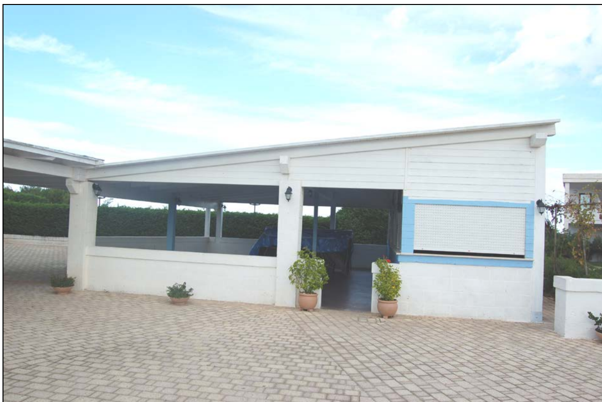
Particolare Chiosco bar, pergolato da mantenere a carattere fisso - permanente