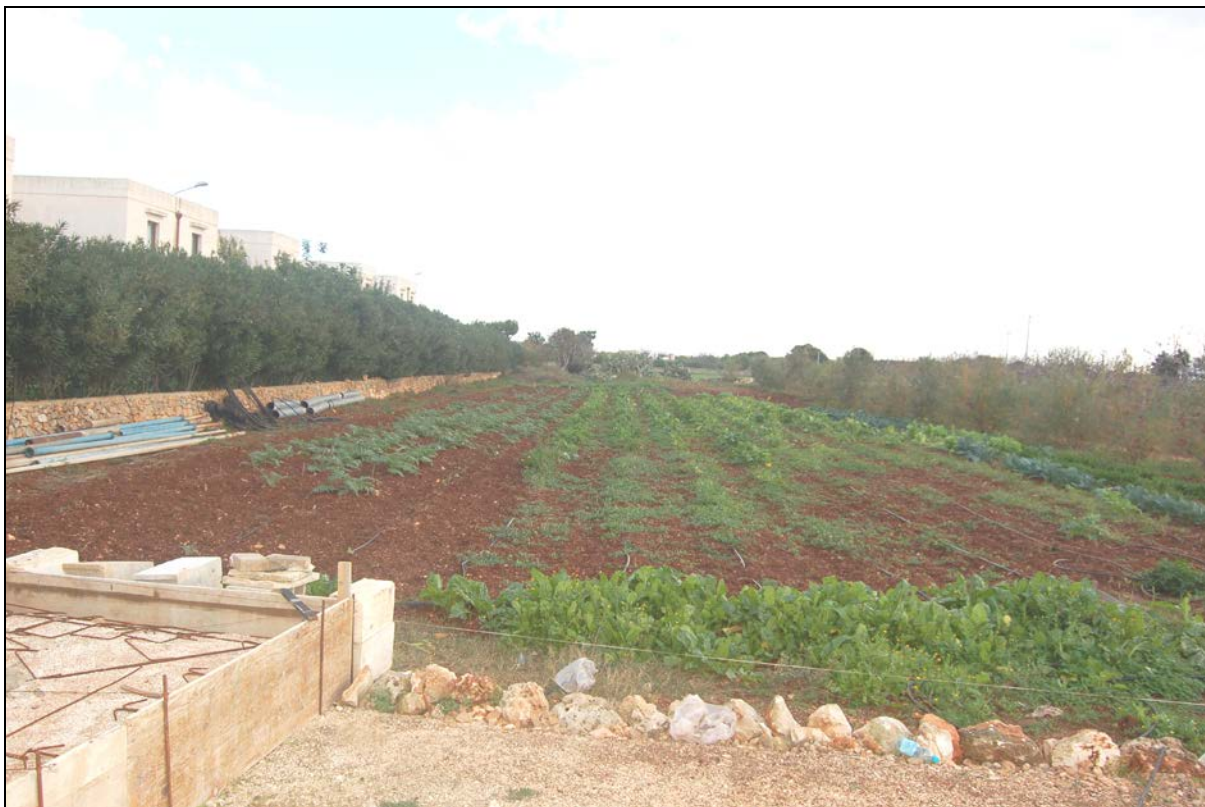
Particolare terreno agricolo oggetto di ampliamento