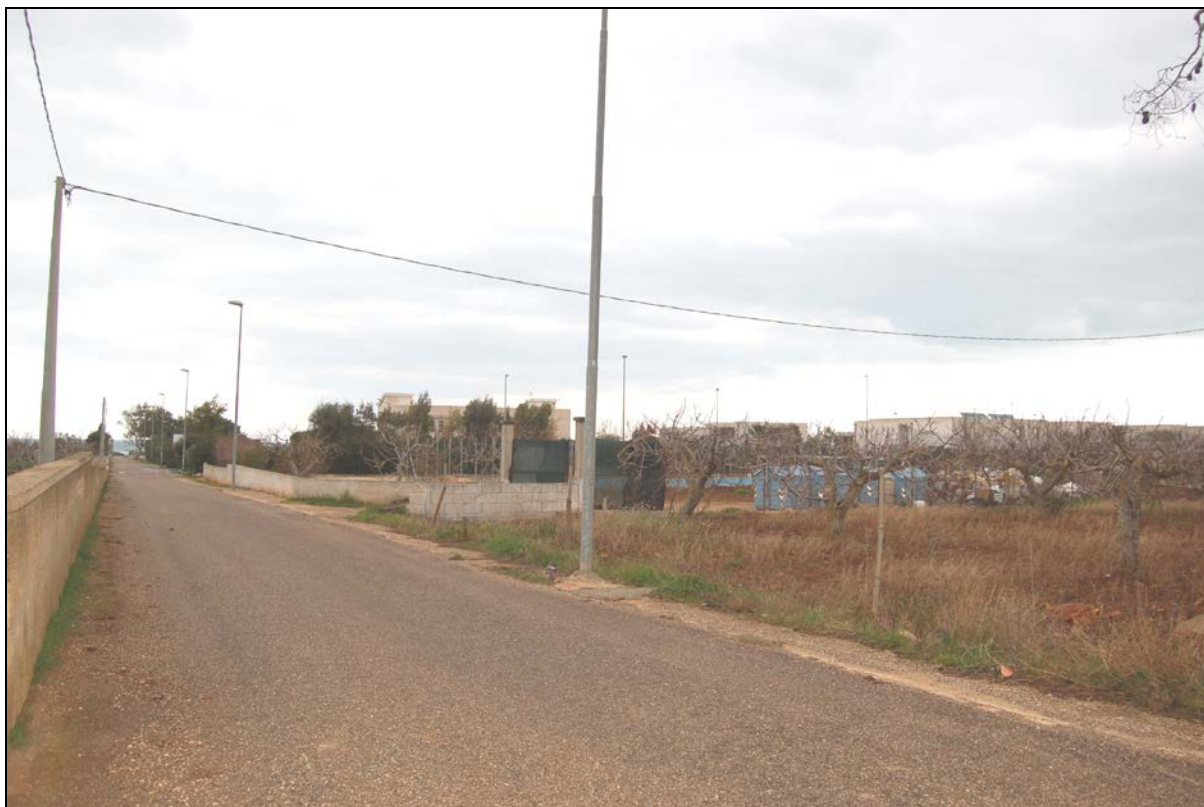
Struttura ricettiva percorrendo strada comunale Bufalaria