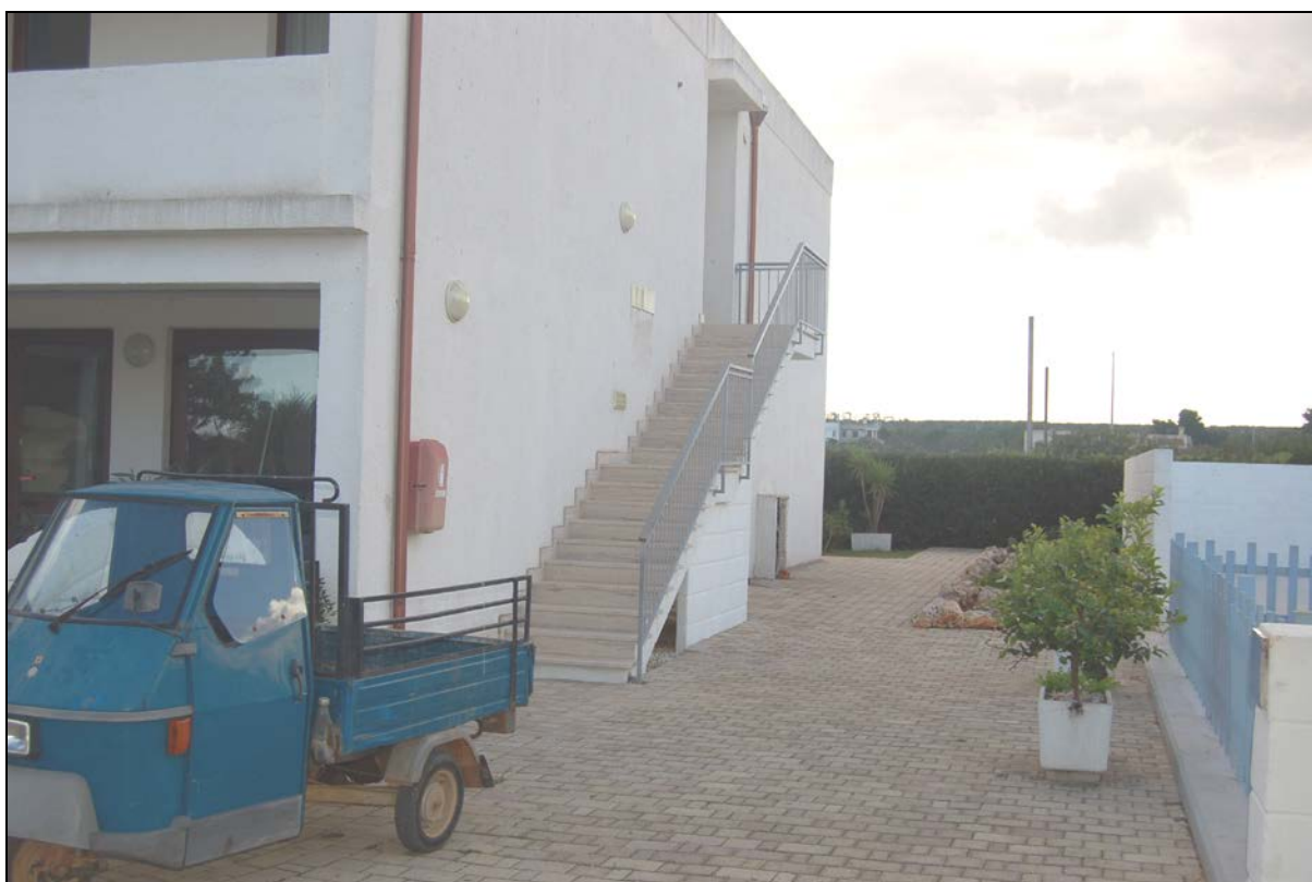
Particolare blocco camere "A" esistente