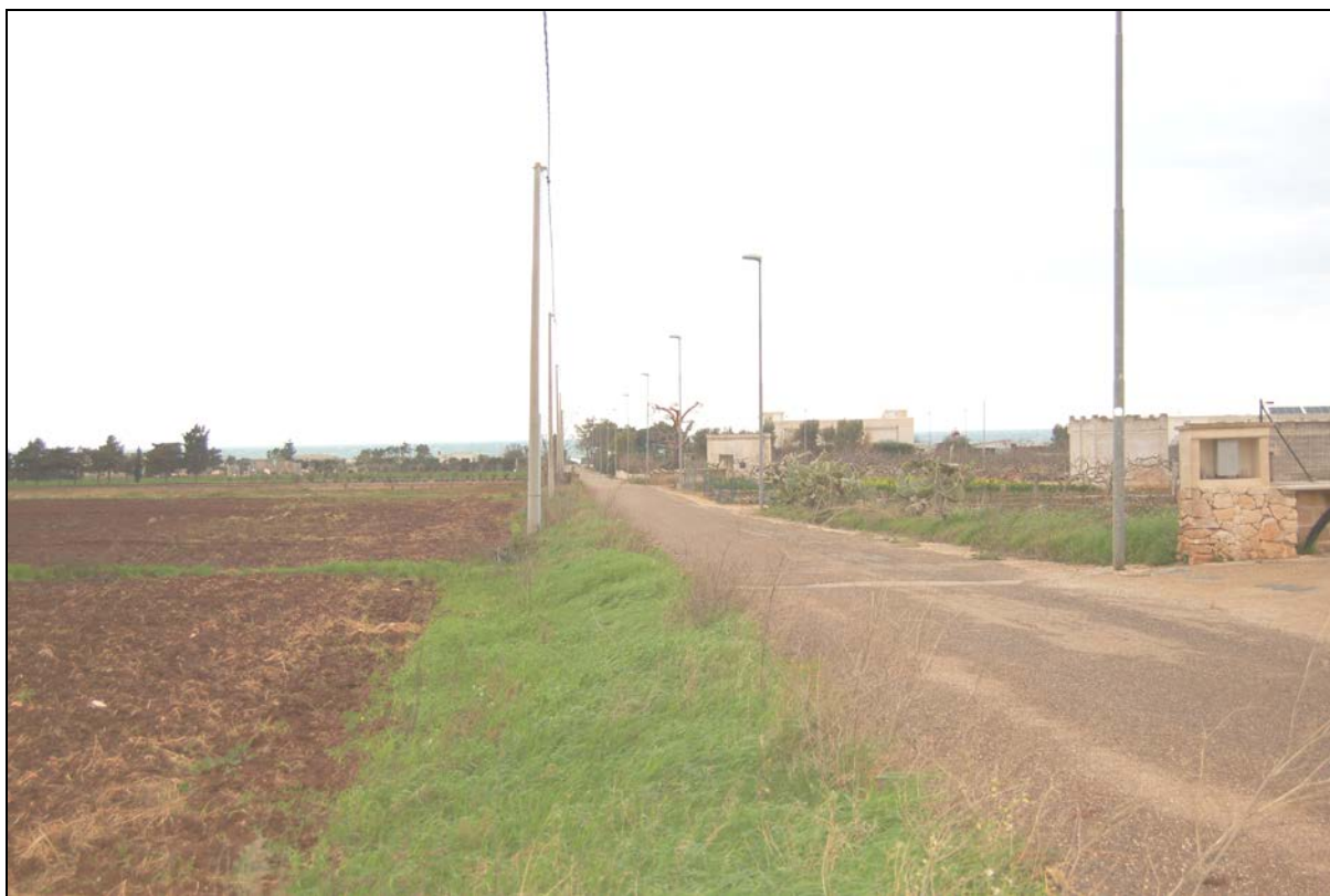
Struttura ricettiva percorrendo strada comunale Bufalaria