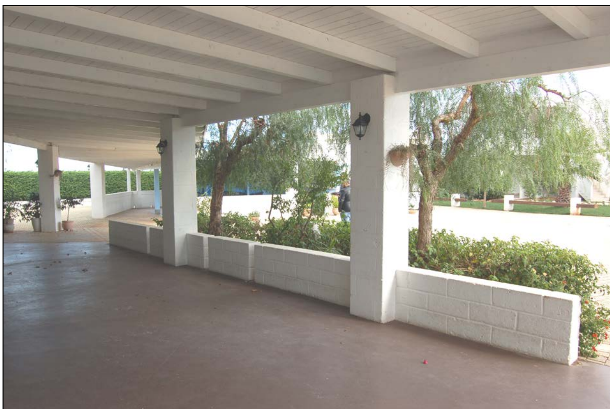
Particolare ristorante e pergolato da mantenere a carattere fisso - permanente