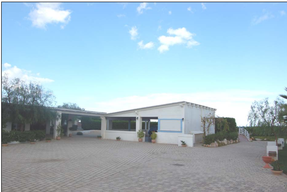
Particolare Chiosco bar, pergolato da mantenere a carattere fisso - permanente