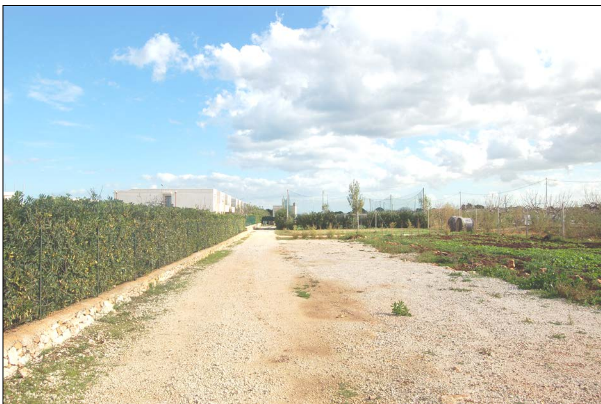
Particolare terreno agricolo oggetto di ampliamento