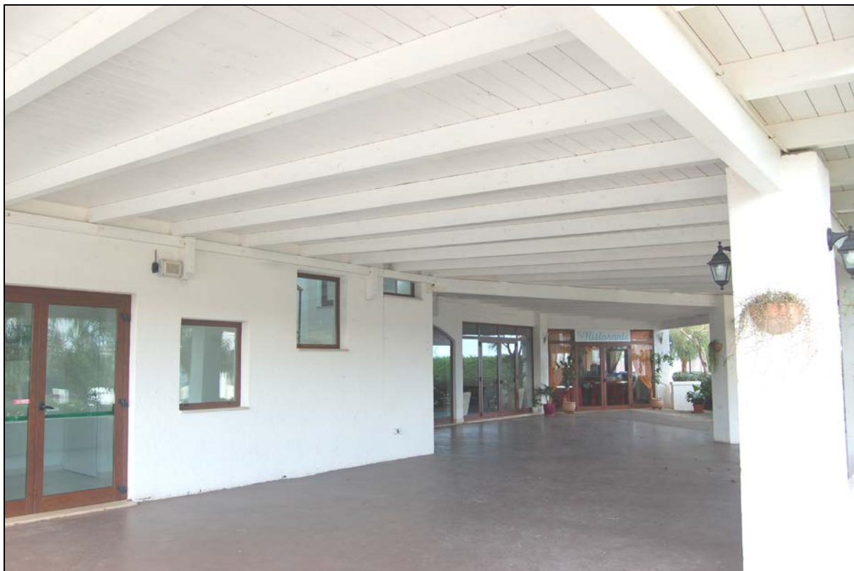
Particolare ristorante e pergolato da mantenere a carattere fisso - permanente